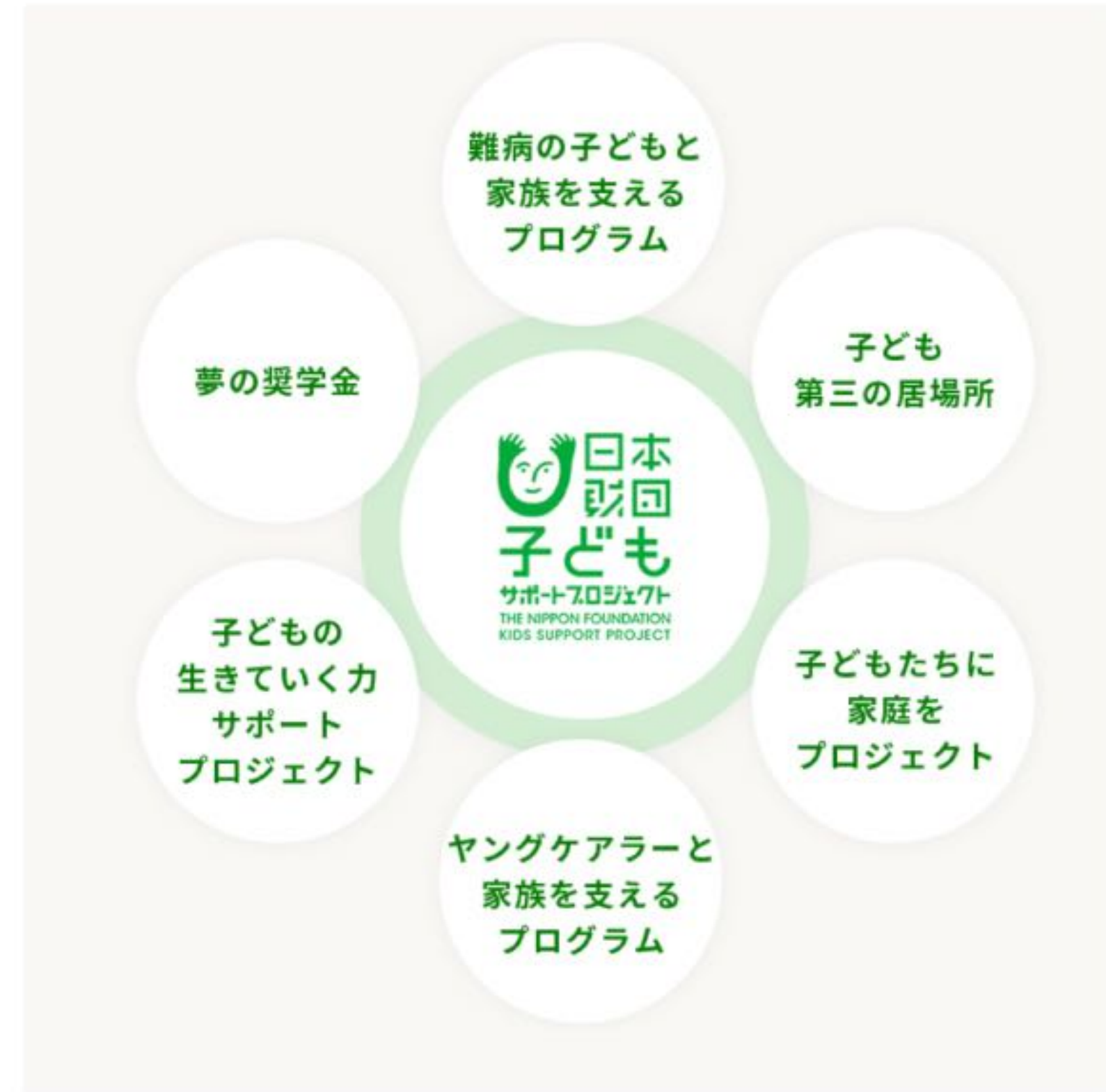
イラスト 日本財団子どもサポート基金のサイトより 2024/3/13